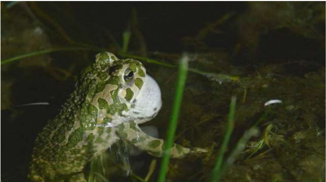
Kvækkende Grønbroget Tudse i Gåsesøen (C2) på Avnø.

Grønbroget tudse findes i Vordingborg i tre adskilte bestande: 1) bestanden på Svinø, sydsiden af Dybsø Fjord, Avnø Fjorden og Knudshoved, 2) bestanden i Vordingborg og 3) bestanden på Bogø og Vestmøn. Hertil kommer helt isolerede forekomster (få individer) ved Lundby og Elmelunde.