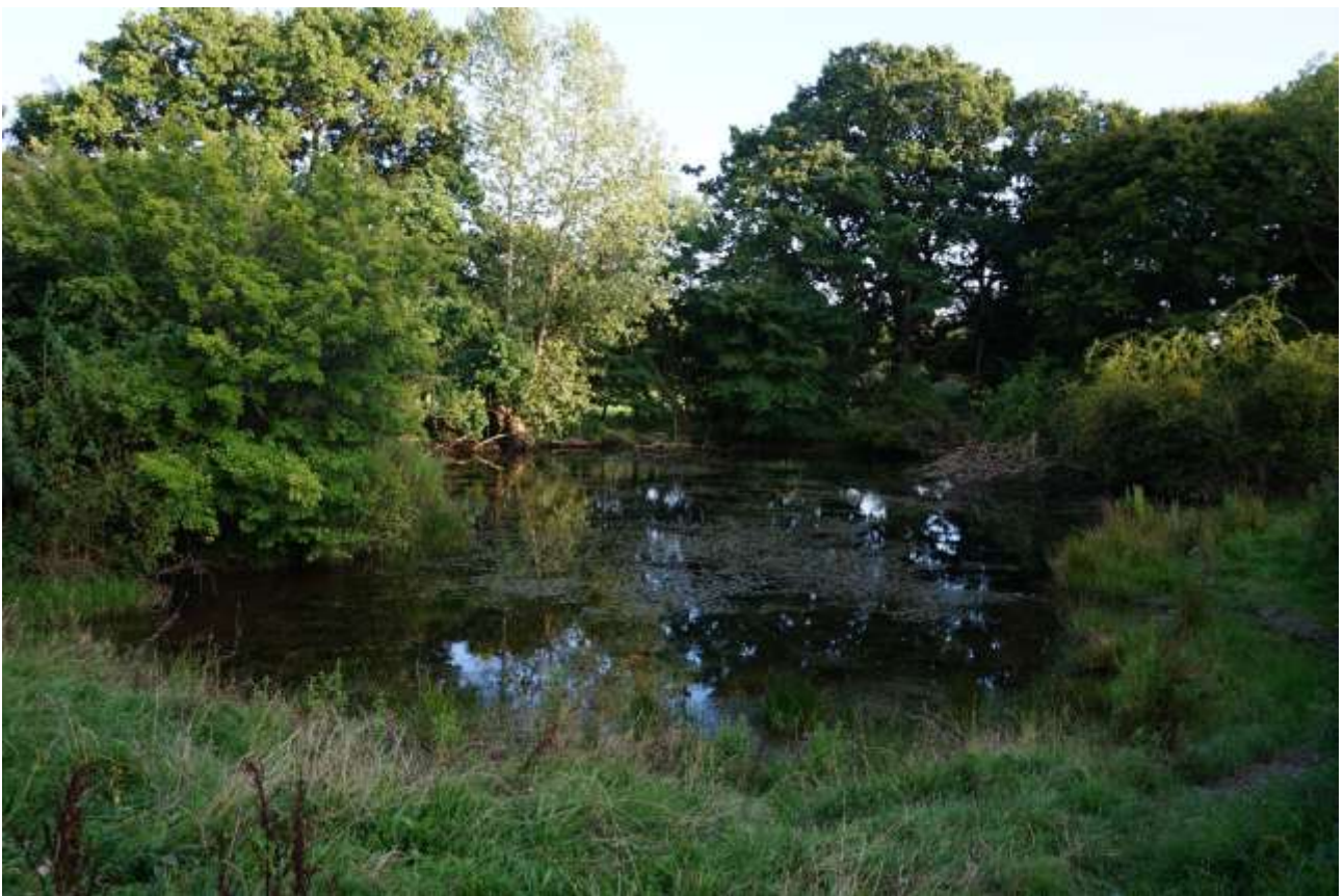
Det oprindelige løvfrø-vandhul, P5, i Bøndernes Egehoved

Der er i siden 1989 gjort en betragtelig indsats for den lille, isolerede bestand af løvfrøer på Jungshoved. I de seneste 4 år er der gjort endnu en stor anstrengelse for løvfrøerne omkring Roneklint med gravning af flere nye vandhuller og etablering af ekstensiv græsning omkring disse, bl.a. med stor støtte fra Den Danske Naturfond. Flere af de nye vandhuller (P6, P8, P9) er da også indtaget af kvækkende hanner i 2016 og 2017, så en vis spredning kan konstateres. Det oprindelige vandhul (P5) ligger endnu lidt skyggefuldt og har ikke genvundet fordums styrke med indtil 100 kvækkende hanner.