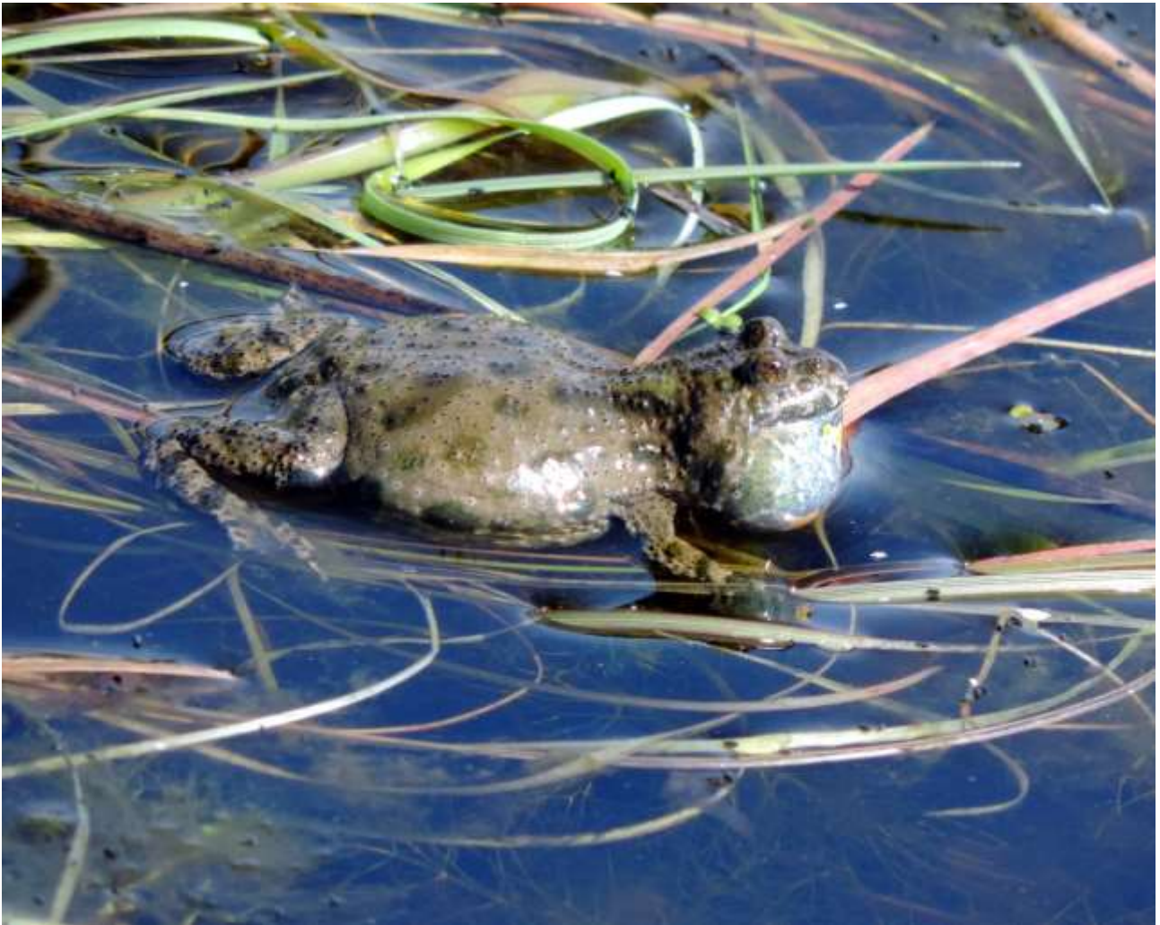
Klokkefrø fra Knudsskov, B21, Maj 2017.

Klokkefrøen er meget afhængig af vandkvaliteten i såvel yngle- som fourageringsvandhuller. Der skal således findes lavvandede vandhuller, som ikke tørrer ud henover sommeren. Samtidig er det vigtigt, at der i tilknytning hertil findes dybere permanente vandhuller, hvor den kan søge føde. Prædation fra fisk på æg og yngel og fra hejrer på voksne individer kan undertiden være en trussel for lokale bestande. Desuden trives arten bedst, hvor omgivelserne er ekstensivt græssede arealer eller overdrev, gerne med en udyrket bræmme omkring det enkelte vandhul.