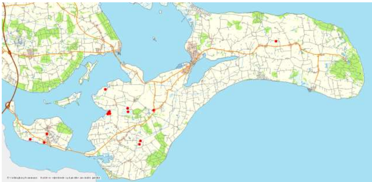
Vandhuller på Farø, Bogø og Møn hvor der er registreret grønbroget tudse i 2017