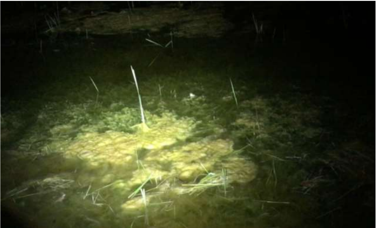
På billedet ses en kvækkende grønbroget tudse mellem voldgravens alger og vandplanter.