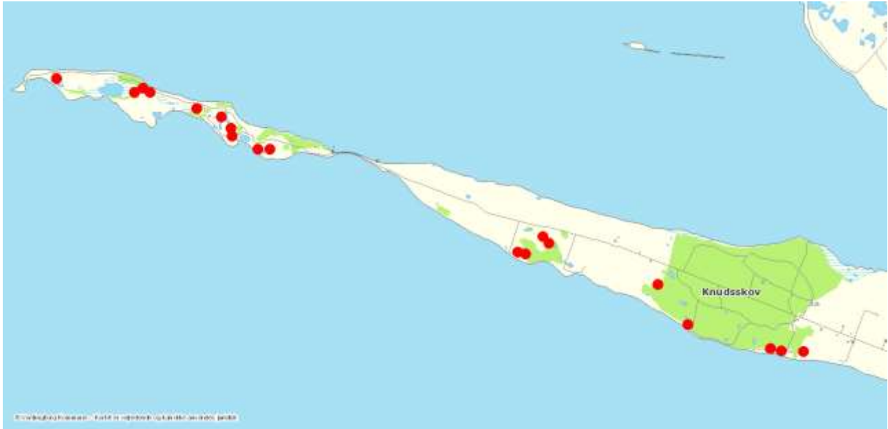
Vandhuller med Klokkefrøer i 2017.

Klokkefrøbestandene er overvåget intensivt forår og sommer 2017.