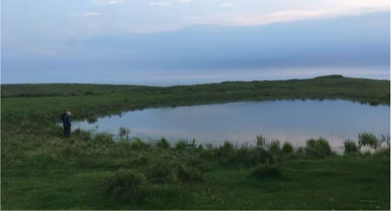
Vandhullet A9 hvor der i 2017 vurderes at være over 200 voksne klokkefrøer.